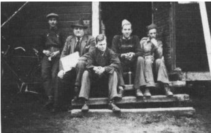
På trappan till affärsmagasinet

I förrådsmagasinet, som tillhörde affärsfastigheten, pågick under gengastiden på 1940-talet tillverkning av gengasved. Enligt utsago skulle någon i Burman-släkten vara drivande i detta.