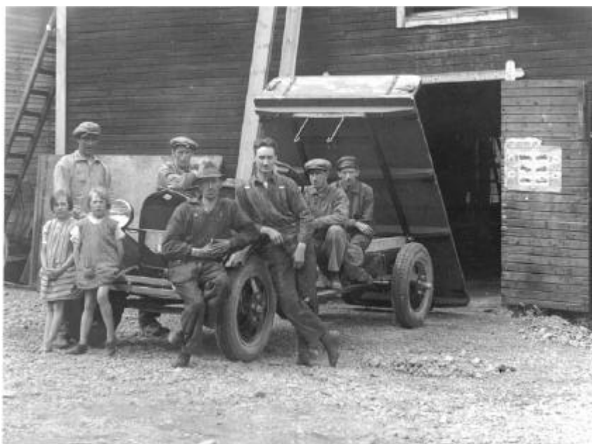
En A-Ford blir lastbil i slutet av 1920-talet.