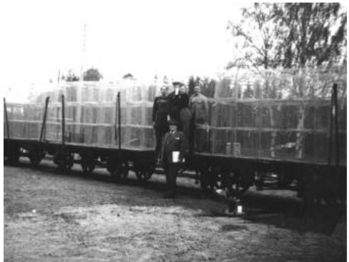
Järnvägsvagnar fullastade med mjårdar.

Under tidigt 1950-tal pågick tillverkning av mjårdar i affärens förrådsmagasin. Produktionen var ganska omfattande att döma av de fullastade järnvägsvagnarna, som syns på fotografiet här bredvid. Vagnarna är fotograferade på stationen i Högen. Handlare Eriksson var den drivande i rörelsen.