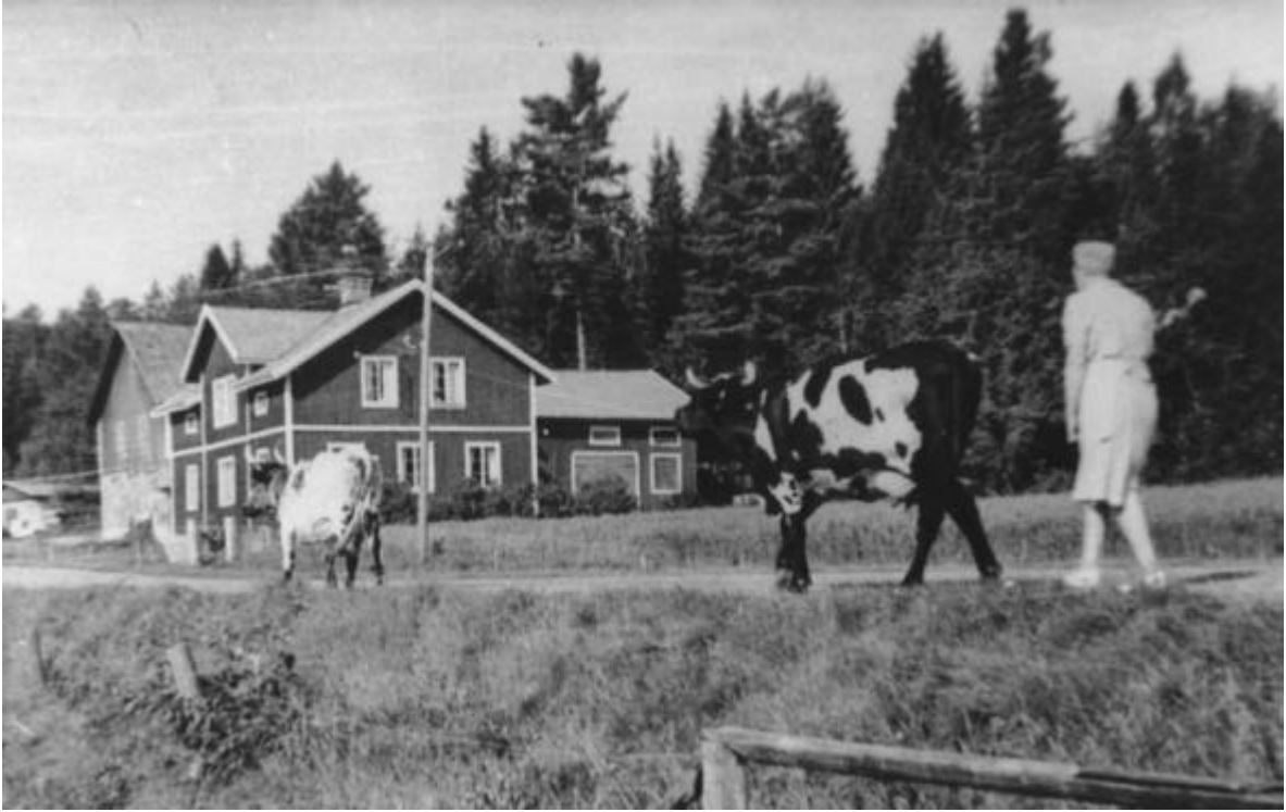
Huggtorpet och Signe Thur med korna