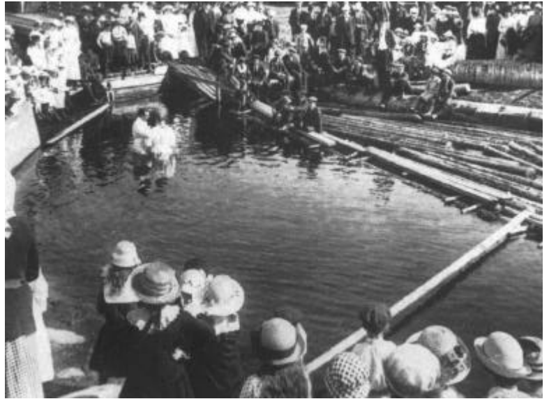
Dop i Sågdammen, Gränsfors