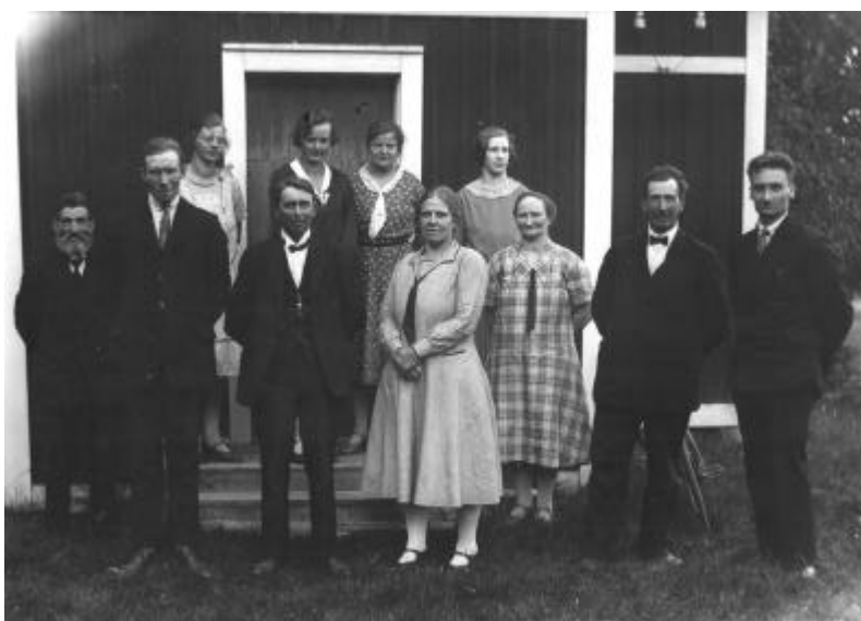
Utanför Missionsalen i Högen.